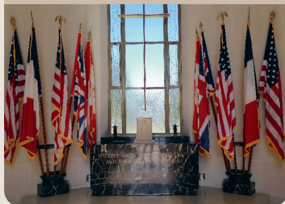
Mémorial américain-cimetière militaire de Colleville-sur-Mer en Normandie

Bon appétit pour ce repas chargé d'Histoire.